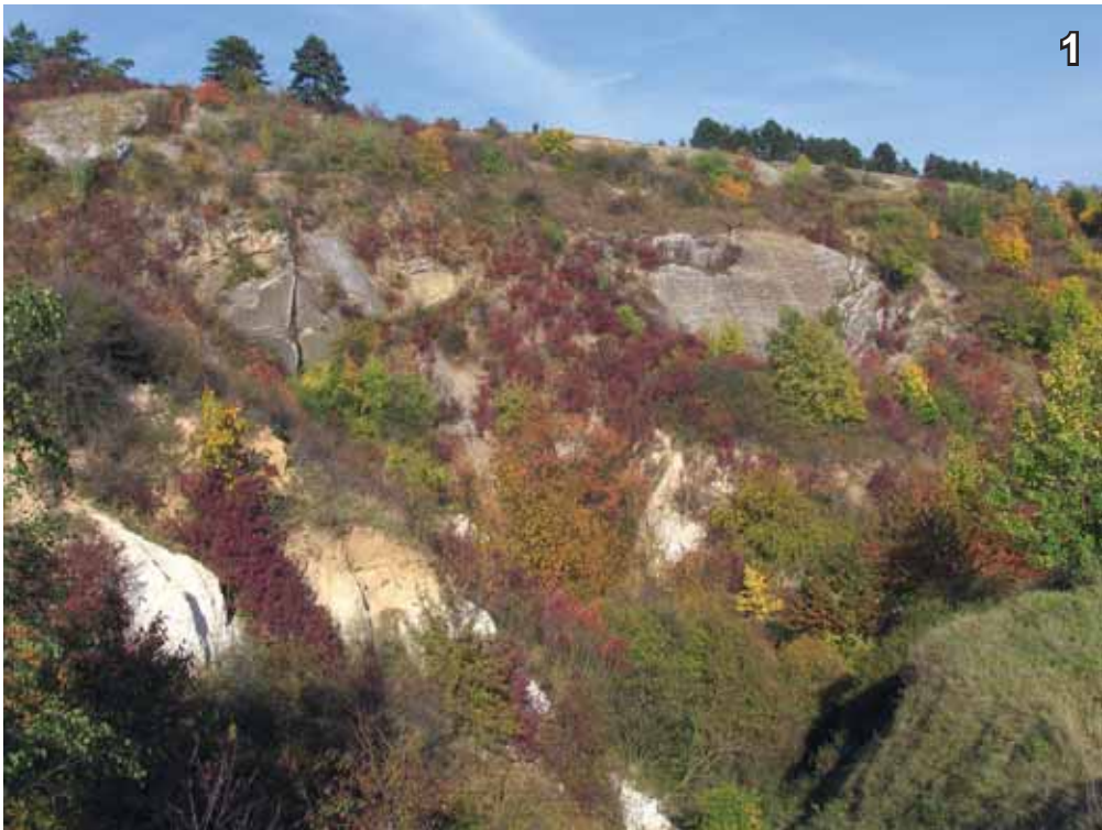
Obr. 1–3. PP Prokopské a Dalejské údolí – sledovaná stanoviště (1 – teplomilné křoviny s charakterem lesostepi, 2 – polní meze, 3 – niva Dalejského potoka) (foto M. ANDĚRA).

Zastoupení druhu v celkovém materiálu (D 0,4 %; tab. 1) bezpochyby neodpovídá reálnému stavu, neboť při odchycích do sklapovacích pastí se vzhledem k tělesné velikosti chytá spíše sporadicky.